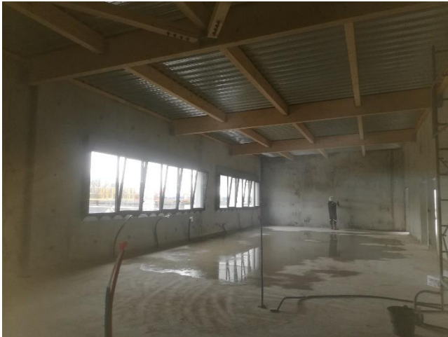
Salle de classe à l'étage

Depuis début décembre, maçons, charpentiers, électriciens, menuisiers et couvreurs se côtoient sur le chantier. Le planning annoncé est respecté. Nous sommes dans les temps.