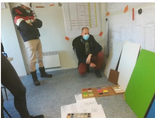
Choix des coloris intérieurs